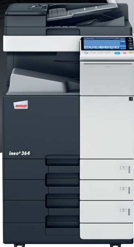
ineo+ 364 con mibiletto con cassetto da 500 fogli (PC-110) e alimentatore originali Dual scan (DF-701)