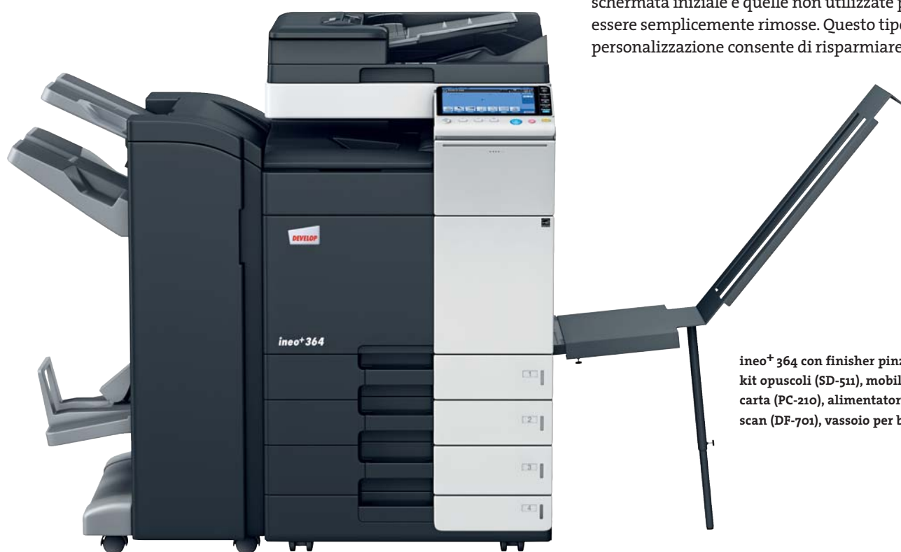
ineo+ 364 con finisher pinzatore (FS-534), kit opuscoli (SD-511), mobiletto con 2 cassette carta (PC-210), alimentatore originali Dual scan (DF-701), vassoio per banner (BT-C1e)

Molti sistemi multifunzione per ufficio sono complessi da utilizzare. ineo+ 224/284/364, viceversa, è semplicissima. Un concetto di funzionamento semplice e intuitivo assicura una facilità d'utilizzo analoga a quella di uno smartphone o di un tablet. Il touchscreen capacitivo da 9 pollici è dotato di funzioni note come flick&drag e grazie a una nuova struttura di navigazione del menu è possibile visualizzare tutte le funzioni contemporaneamente e selezionare le impostazioni desiderate con pochi clic. Le funzioni utilizzate con maggiore frequenza possono essere lasciate sulla schermata iniziale e quelle non utilizzate possono essere semplicemente rimosse. Questo tipo di personalizzazione consente di risparmiare tempo.