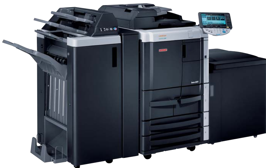
ineo 601 con fascicolatore FS-610, post inseritore PI-504 e mobiletto grande capacità LU-405