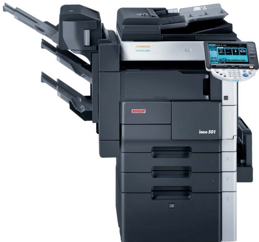
ineo 501 con finisher graffiatore incorporato FS-522, kit di piegatura SD-507 e cassetto a grande capacità PC-407

ingombro ridotto, anche grazie al finisher incorporato opzionale, e risulta facile da utilizzare, in virtù di un pannello comandi dotato di uno schermo a colori di grandi dimensioni. In un mondo come quello della stampa monocromatica, in cui tutti i prodotti si somigliano, queste esclusive funzioni fanno una grande differenza.